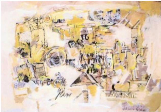
La obra: Sin título

Los tonos de color claro, con planos de grises y ocre, sobre una superficie casi blanca, se combinan con escrituras, letras, números y figuras geométricas, que recuerdan a un muro callejero. La obra, llena de sutileza, lirismo y sensibilidad, posee, al mismo tiempo, una gran fuerza plástica. Conjugando las influencias del Informalismo abstracto de los años 50, con una expresión personal en la que los signos y el color constituyen la esencia de la obra, introduce la presencia de lo humano a través de los grafismos, en una composición llena de expresividad y de calidez, en la que los elementos plásticos puros, la línea y el color, se integran en un todo lleno de belleza y armonía.