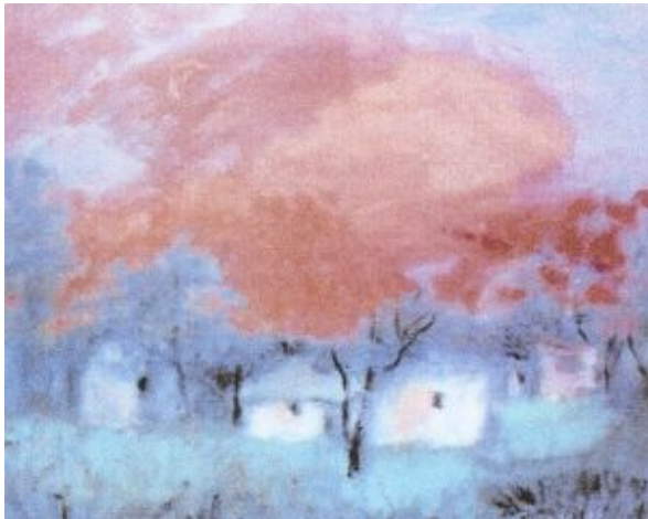
La obra: Paisaje

Un paisaje se insinúa: pequeñas y blancas casas parecen emerger y al mismo tiempo esconderse entre la atmósfera brumosa. La vegetación también se insinúa y se muestra, destacando el vigoroso árbol central cuya fuerza está acentuada por los trazos negros, de gran intensidad plástica. Pero es el juego cromático el gran protagonista, con el contraste entre los matices azules y el vigoroso, y al mismo tiempo poético, tono rosado de la copa, que extendiéndose horizontalmente parece abrazar a las viviendas humanas. Casi sentimos un profundo silencio impregnado de poesía.