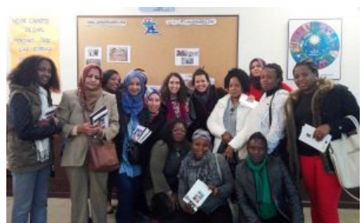
Taller de sensibilización contra la MGF realizado por UNAF