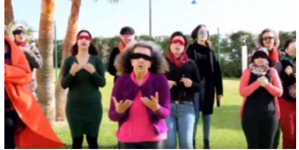
Foto: imagen de la versión marroquí del himno "El violador eres tú". Video: