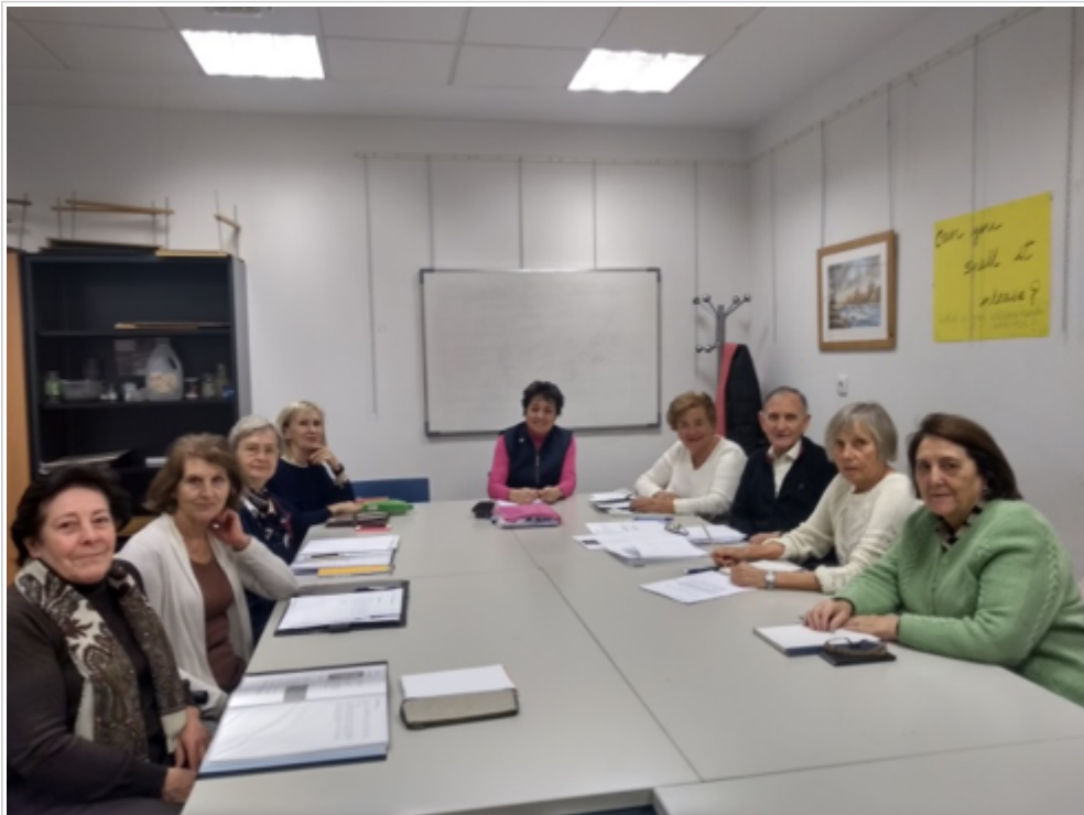
Grupo de grafología del Centro de Mayores Pío Baroja