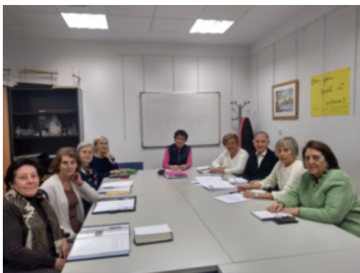
Grupo de grafología del Centro de Mayores Pío Baroja