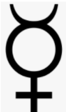
Símbolo gráfico del planeta Mercurio

Conviene tener en cuenta que es un planeta considerado “interior” ya que es el que más cerca se encuentra del Sol y por tanto el que tiene una órbita a su alrededor más rápida y corta. En este sentido conviene observar su velocidad, su capacidad de progresar por los signos y si se encuentra o se pone a lo largo de la vida en posición directa o retrógrada para lo cual se acudiría a las efemérides y se partiría desde el momento de nacimiento, observando si al nacer su ritmo de avance por el Zodíaco era normal, muy rápido o muy lento, ya que habla también del ritmo y velocidad de la mente y su forma de expresión.