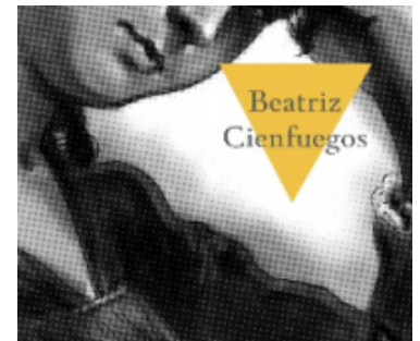
La Pensadora Gaditana