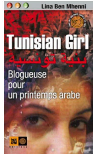
Portada del libro de Lina Ben Mhenni