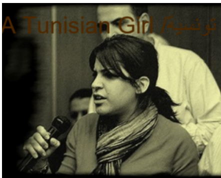
Lina Ben Mhenni [1]

V.D.- ¿Cómo explicas que la gente apoye el ascenso de partidos como Nahdah, que quieren un retroceso en los derechos de la mujer basados en la religión?