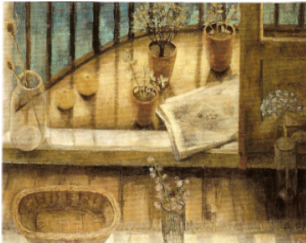
La obra: Balcón (1958)

De gran armonía compositiva y cromática, la obra se estructura en torno a las formas verticales y horizontales. La leve inclinación de la franja blanca, las formas curvas de las macetas y el periódico, rompen la rigidez de las líneas rectas, dando dinamismo al sosegado y sereno espacio de planos intercalados y una sobria gama tonal que dejan adivinar la influencia del cubismo, al mismo tiempo que nos muestran la sutil presencia de los objetos domésticos. La perspectiva, “a vista de pájaro”, nos sitúa a la artista por encima de lo observado, a cierta distancia, en una representación plástica y simbólica en la que el distanciamiento de la visión interior también nos permite intuir una prisión en ese rincón hogareño y amable. La ventana es el lugar privilegiado desde el que se contempla tanto el exterior como el interior en muchas obras plásticas de mujeres artistas.