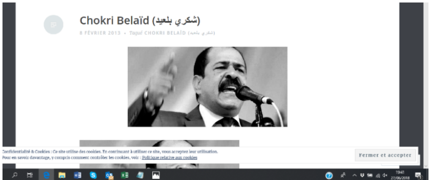
Post vinculado al Blog sobre el asesinato político del líder de izquierdas Chokri Belaïd