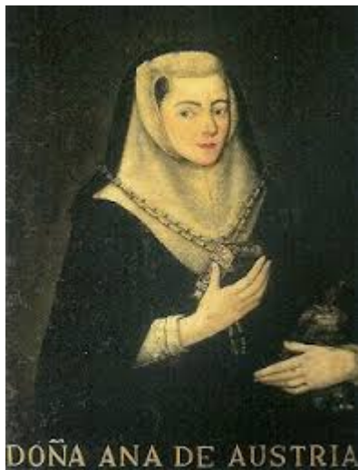
Ana de Austria

Ahora que por estos lares empieza el calor, podemos probar a subir en el mapa de España hacia lugares más frescos. Así que les llevo a Burgos. Aunque es una provincia de Castilla y León con una historia larga y compleja, en esta ocasión sólo les acompañaré a un periodo concreto, el pasado de una abadía con una abadesa ilustre: Santa María la Real de las Huelgas y Ana de Austria y de Mendoza.